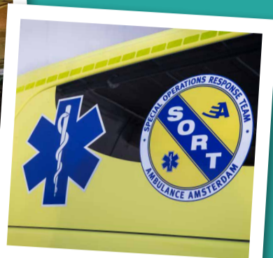
Stand-by WK voetbalrellen in Amsterdam-West